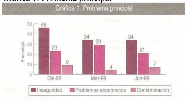
Gráfica 1. Problema principal

Es importante saber qué tan directamente afecta este problema de la inseguridad a la población y para ello el CEOP indaga esta incidencia a partir de la pregunta: "¿A usted o a alguien de su familia inmediata los han asaltado en los últimos meses?". Los resultados aunque no son satisfactorios sí son optimistas, ya que la respuesta afirmativa ha disminuido 10% en lo que va de la actual administración, y a partir de junio de 1998 las tendencias entre quienes sí han padecido un asalto y los que no se han revertido, y su diferencia no sólo ha continuado sino que ha aumentado: lo que significa que si bien el problema continúa incide menos en la población.