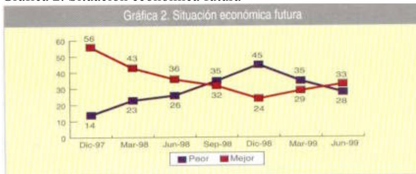
Gráfica 2. Situación económica futura

Toca el turno al análisis sociodemográfico de quienes respondieron acerca de la situación económica futura; como vemos en el cuadro 2, a mayor juventud mayor optimismo, por lo