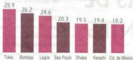
CIUDADES MÁS POBLADAS DEL MUNDO, 2015 (Población en millones)