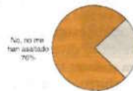
G.6. ¿A usted o alguien de su familia lo han asaltado en los últimos 3 meses?, diciembre 2000