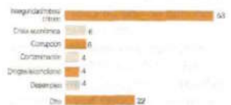
G.2. Seguridad pública como principal problema en la Ciudad de México