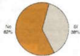
G.5. ¿A usted lo han asaltado en los últimos 12 meses?, diciembre 2000